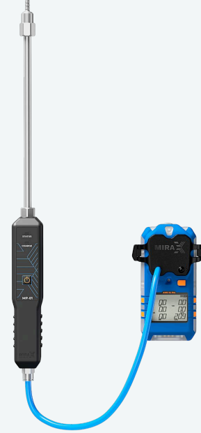
Моторизированный насос MP-01 для отбора проб