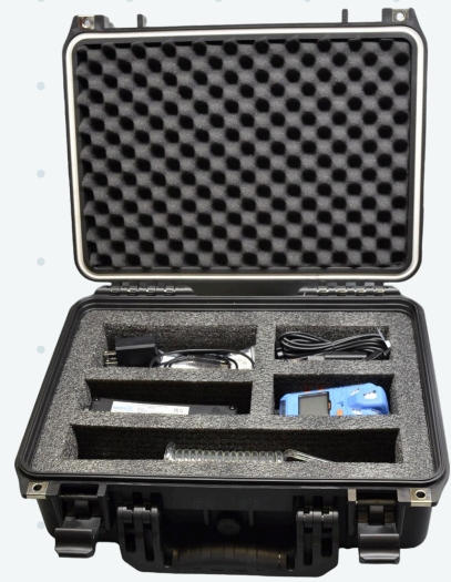
Кейс для хранения и переноски